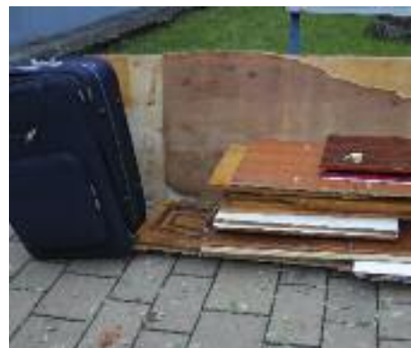
So ist es richtig: Bereitstellung von Sperrmüll und Altholz