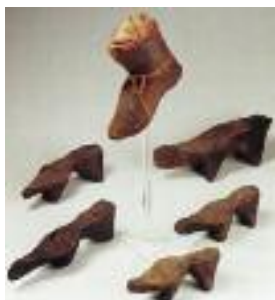
„Trippen“, die unter die Schuhe geschnallt wurden, um trockenen Fußes die morastigen Straßen passieren zu können.

Im 14. Jahrhundert bestand der Abfall in der Stadt vorwiegend aus Scherben, Leder, Holz, Kehrriech, Bauschutt, Schlachtabfällen, Kadavern und Fäkalien. Eine Unterscheidung von Abwasser und Abfall im heutigen Sinne gab es nicht. Alles war „Unrat“ und „Unflat“. Mit der wachsenden Bevölkerungszahl und der städtischen Enge nahmen auch die Umweltprobleme zu. Abfälle wurden auf die Straße geworfen, Misthaufen machten das Passieren beschwerlich. Fäkalien, Kleintierkadaver, Schlachtabfälle und Tierkot verschmutzten die Straßen und verpesteten die Luft. Die Stadtbewohner schnallten sich daher hölzerne Unterschuhe, die sogenannten Trippen, unter die empfindlichen Lederschuhe, um trockenen Fußes die morastigen Straßen passieren zu können. Aber auch im Haus wurden die Trippen oft getragen, um sich im Winter vor den kalten Steinböden zu schützen. Aus dieser Zeit stammt auch der Ausdruck „tripeln“. 1