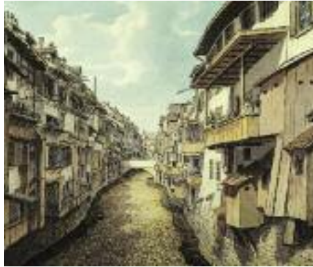
Hölzerner Abtrittkerker über einem Stadtbach in Basel, der als Abwasserkanal genutzt wurde

In den Häusern wurden Abfallgruben und -keller angelegt und aufgelassene Brunnen zur Abfallentsorgung genutzt. Auch befanden sich häufig Latrinen – das „heimlich