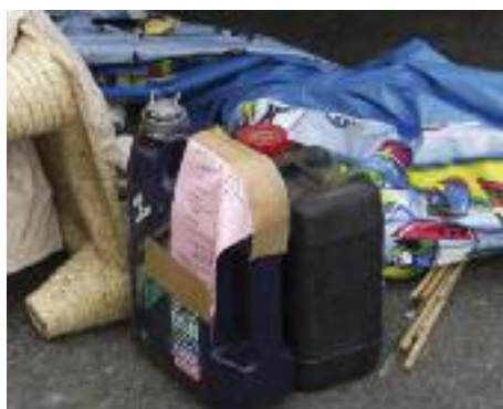
Problemstoffe (z.B. Ölkanister) dürfen auf keinen Fall zur Sperrmüllabfuhr gestellt werden.

Bitte beachten Sie die 10 Grundregeln der Sperrmüllabfuhr, dann dürfte alles reibungslos ablaufen: