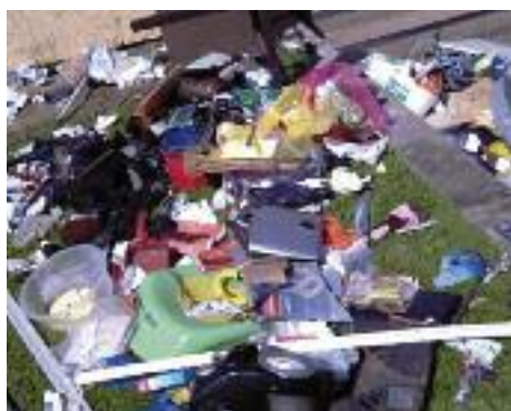
Kleinteile, die in den Mülleimer passen sind kein Sperrmüll

In den vergangenen Monaten gingen verstärkt Beschwerden beim Abfallwirtschaftsamt ein, dass Abfälle schon mehrere Tage vor dem Abholtermin an der Straße bereitgestellt werden, was zur Folge hat, dass diese Sperrmüllhaufen rasant zu Müllbergen heranwachsen.