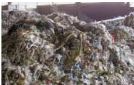
Aus dem Biomüll aussortierte Plastikfolien.

Die Verwendung von so genannten Biobeuteln ist nicht möglich, da sie den Störstoffanteil in unserem Biomüll erhöhen.