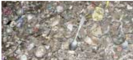
Aus dem Biomüll aussortierte eisenhaltige Metallgegenstände.

Störstoffe im Bioabfall beeinflussen die Kompostqualität bezüglich der Schwermetallbelastung negativ. Alles was nicht biologisch verrottet, muss aussortiert werden.