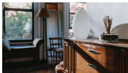
BEWOHNERZIMMER Privates Inventar