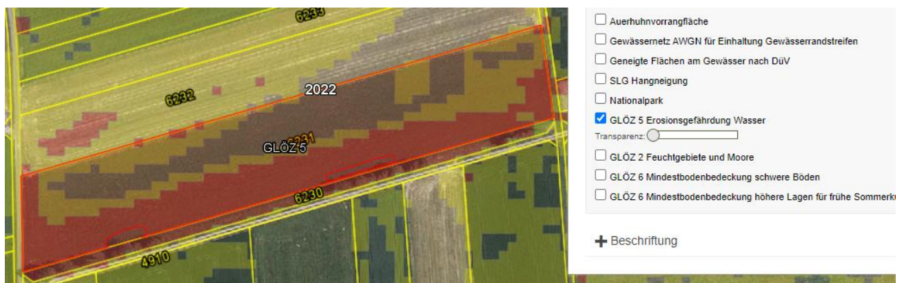
Abbildung 1: Umweltdatenlayer „GLÖZ 5 Erosionsgefährdung Wasser“

Für alle landwirtschaftlichen Flächen in Baden-Württemberg wurde unter Berücksichtigung der drei Faktoren die Erosionsgefährdung je 5 x 5 Meter Rasterzelle berechnet. Die rasterbasierte Erosionsgefährdung ist unabhängig von Flurstücksgrenzen und unterliegt keiner von der Kultur abhängigen jährlichen Veränderung. Im FIONA-GIS sind unter Karten>Umweltdaten>„GLÖZ 5 Erosionsgefährdung Wasser“ die einzelnen 5 x 5 Meter Rasterflächen sichtbar.